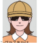
サングラスをかけ人物を特定できないもの 선글라스를 착용해 인물 특정이 불가능한 것